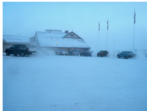
Морозный день в Варангерботн, Сев. Норвегия.

В течение создания этого доклада, на его ранних стадиях, было трудно заинтересовать правильных людей для его работы. Я думаю, что будущие местные академики из коренных народов должны гордиться краем, в котором они живут и взять на себя обязательство участвовать в будущих исследованиях. Нам было очень трудно искать и уговаривать наших собственных экспертов из коренных народов для этого доклада. Это может быть в силу многих причин, но я думаю доклад, а он этого стоит, должен вдохновить коренные народы на изучение их собственных географических и культурных областей. К Арктике имеется глобальный интерес, а это не всегда видно людям, находящимся там все время.