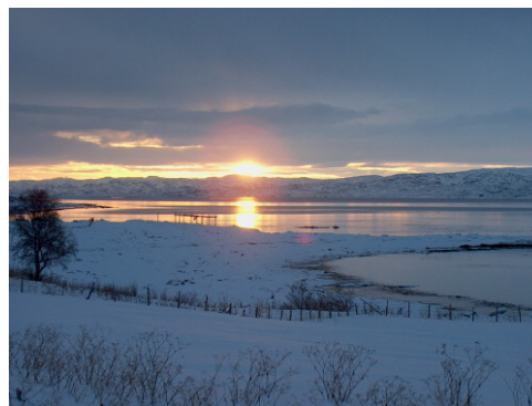
Февральское солнце у Варангерского фьорда, Сев. Норвегия.

“Для полного изменения отрицательных тенденций, образовавшихся десятилетия или столетия назад ... требуется длительный период ‘нормализации’. Таким образом, нельзя требовать мгновенного улучшения.”